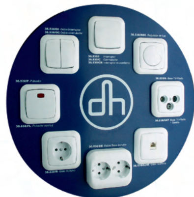
EXPOS.MECANISMOS EXPOSITOR MOSTRADOR DE 8 MEC. EMPOTRAR