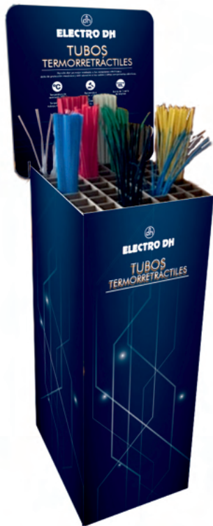
EXP.TUBO TERMOR EXPOSITOR PARA TUBO TERMORRETRACTIL