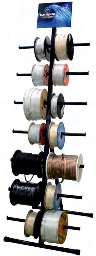
EXPOSIT.CABLES EXPOSITOR PARA CABLE 186 x 57 x 45cm