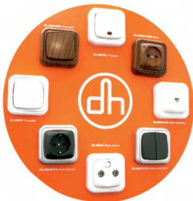
EXP.MEC.SUP EXPOSITOR PARA MECANISMOS DE SUPERFICIE